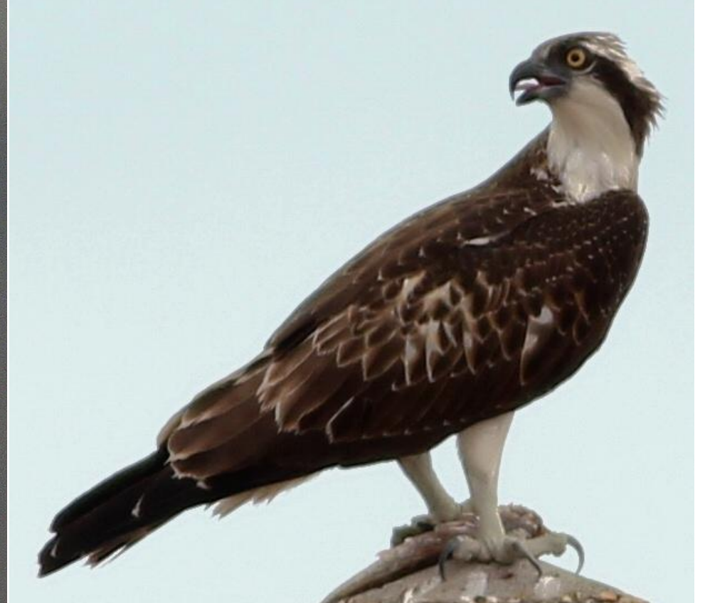
Foto 13: Pandion haliaetus (Águila pescadora). Se muestra el antifaz (a). Foto 14 Pandion haliaetus (Águila pescadora).

(2b) Sin estos caracteres (Fotos 15 y 16)..... ACCIPITRIDAE