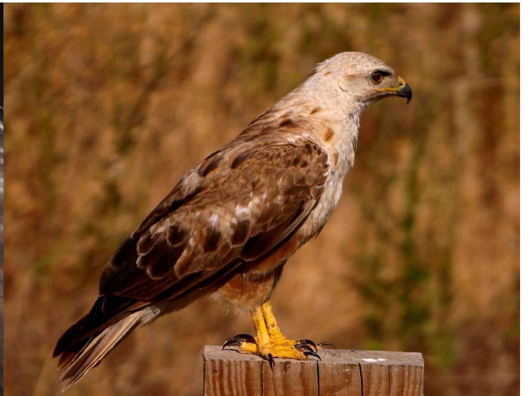
Foto 12: Buteo rufinus (Ratonero moro, busardo moro). A destacar la falta de bigotera y la ausencia de diente.