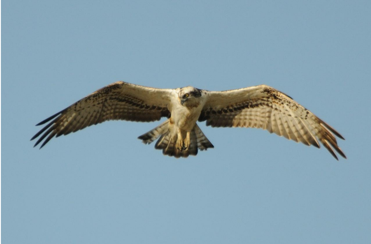
Foto 5: Pandion haliaetus (Águila pescadora). Se puede distinguir fácilmente por sus hábitos alimentarios ya que es el único representante en la Península Ibérica con hábitos piscívoros.

2- (2a) Las alas son largas y angulosas. El vientre, blanco y sin manchas (Fotos 5 y 6)..... PANDIONIDAE (Especie única: Pandión haliaetus )