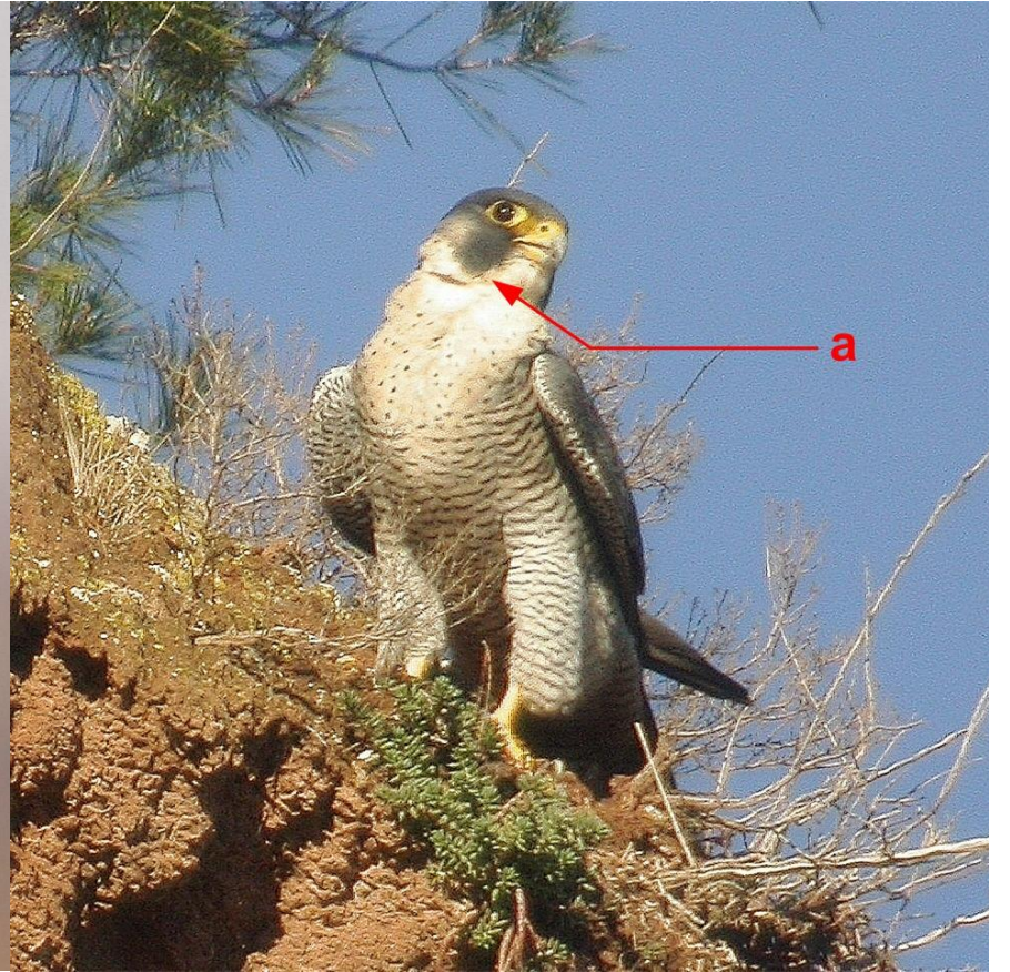
Foto 10: Falco peregrinus (Halcón peregrino). Desde lejos se distingue con claridad la bigotera (a).

1- (1b) Sin estos caracteres (Fotos 11 y 12)..... 2