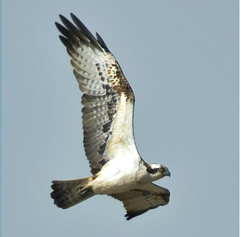
Foto 6: Pandion haliaetus (Águila pescadora). Se puede apreciar el vientre blanco.

2- (2b) Sin estas características (Fotos 7 y 8)..... ACCIPITRIDAE