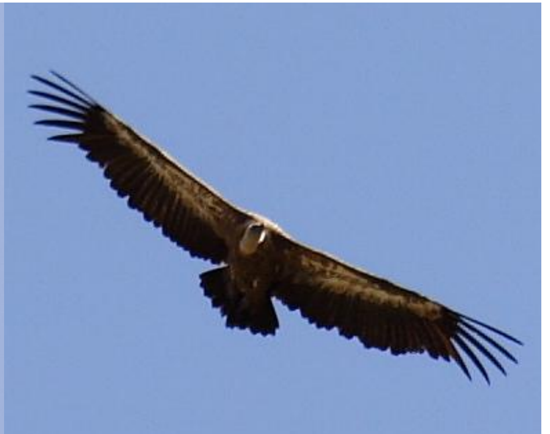
Foto 8: Gyps fulvus (Buitre leonado). Nótese la forma de las alas, rectilínea y no angulosa.