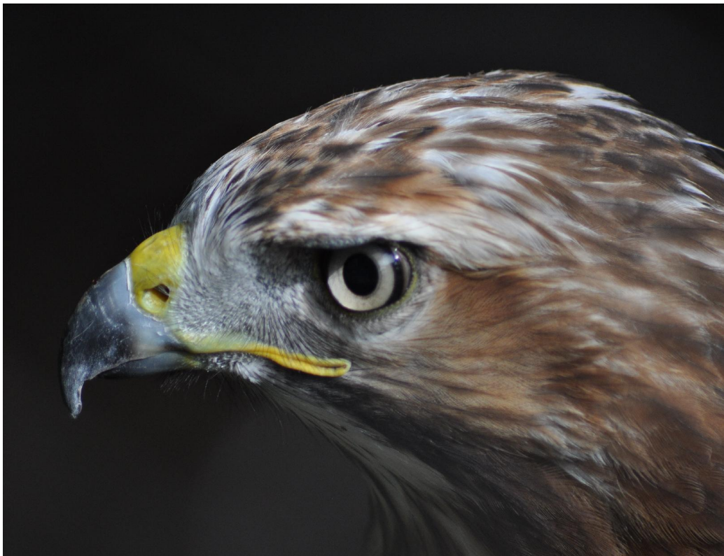
Foto 11: Aquila pennata (Águila calzada). A destacar la falta de bigotera y la ausencia de diente.

1- (1b) Sin estos caracteres (Fotos 11 y 12)..... 2